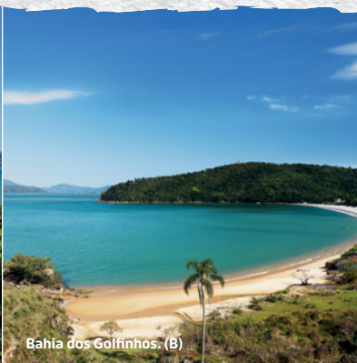
Bahia dos Golfinhos. (B)