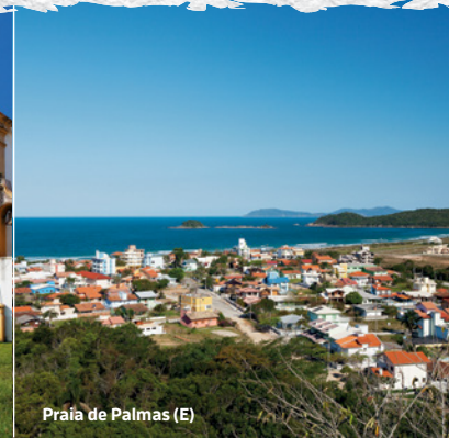
Praia de Palmas (E)