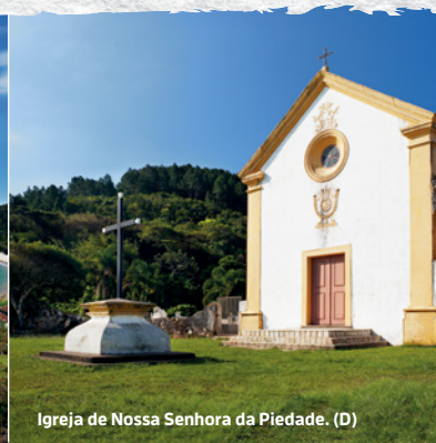
Igreja de Nossa Senhora da Piedade. (D)