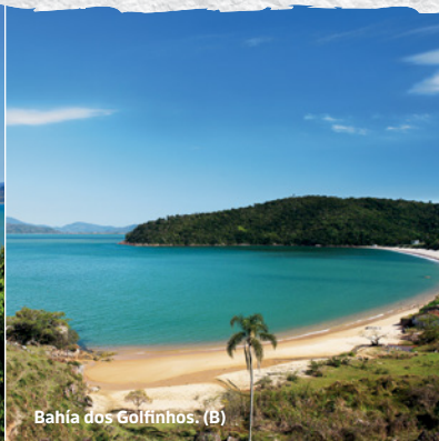
Bahía dos Gólfinhos. (B)