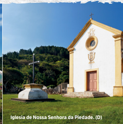
Iglesia de Nossa Senhora da Piedade. (D)