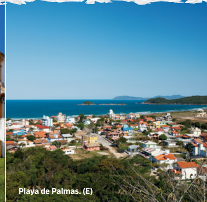
Playa de Palmas. (E)