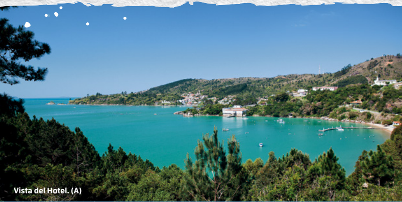
Vista del Hotel. (A)