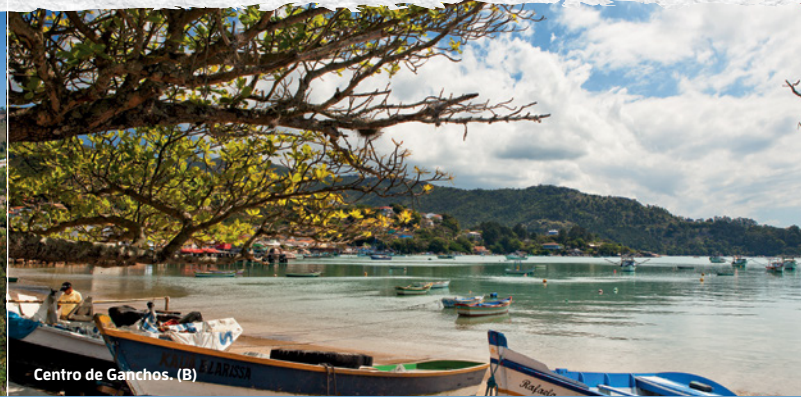
Centro de Ganchos. (B)